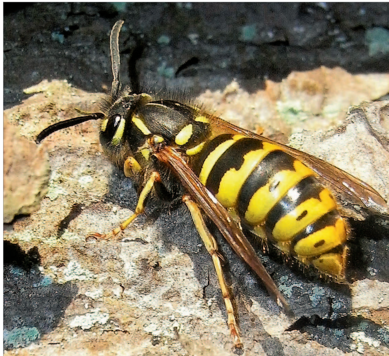
Friedlich sitzt sie da, als hätte sie nie ein Stück Kuchen gestohlen.